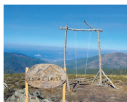
Aldeia de Piódão, Pastel de Tentúgal, Mosteiro de Santa Clara-a-Velha, Praia de Mira e a Serra da Lousã são os ícones regionais premiados no distrito